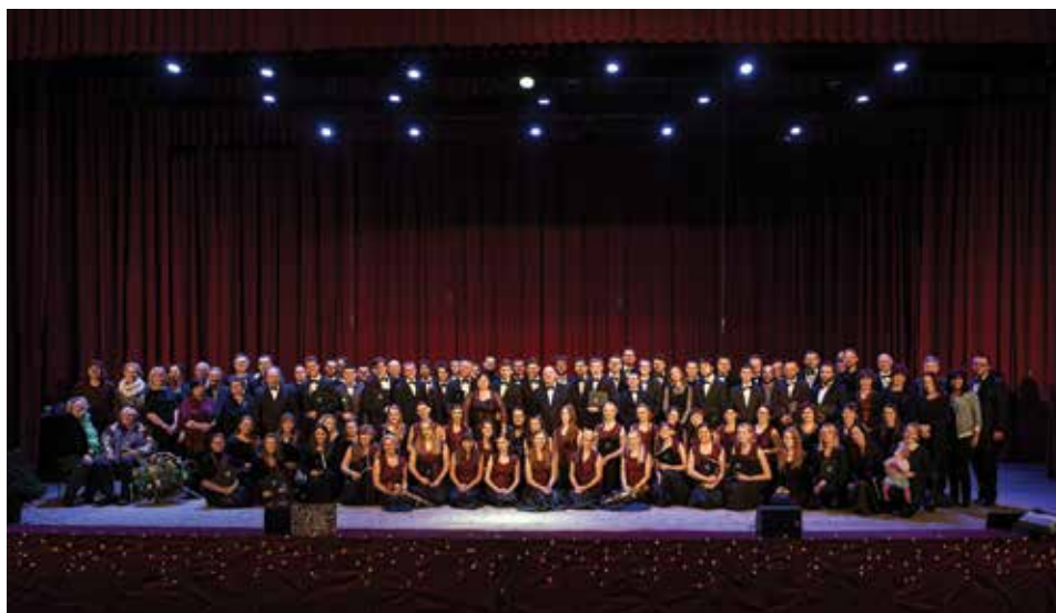
Jubileusz 105-lecia Towarzystwa Śpiewaczego „Harmonia” obchodzono bardzo uroczysto. W programie znalazło się Nabożeństwo Ekumeniczne oraz Koncert Jubileuszowy.

W trzeciej części na scenie pojawili się Absolwenci Chóru Uniwersytetu Śląskiego i wspólnie z „Harmonią” wykonali „ Kyrie ” z Mszy G-dua F. Schubert, „ Kyrie ” z Mszy Koronacyjnej W. A. Mozarta oraz dwa utwory stylizowane folklorem „ Surca je tisa ” i „ Vjeniki ” na ponad 100 głosów. Partie solowe