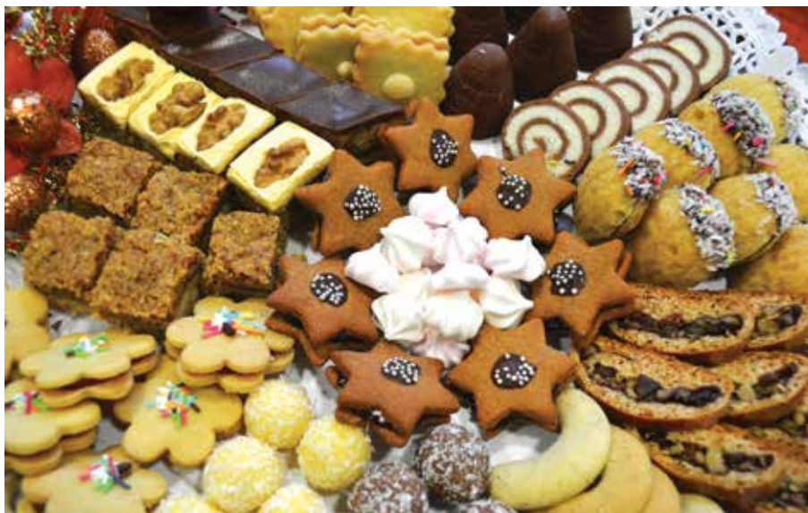
Tradycyjne, świąteczne, cieszyńskie ciasteczka upieczone przez panią Brygidę Grzeszczak...

Wszystkie składniki wymieszać, mocno wygnieść, po czym formować kulki. Do środka można włożyć całego lub półkę migdała. Na koniec kulki obtoczyć w kokosie.