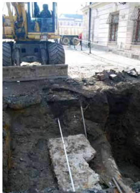
Fragment fundamentów klasztoru ss. Elżbietanek odnaleziony w ul. Matejki.