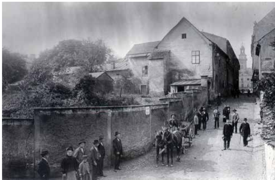
Koniec XIX w., klasztor ss. Elżbietanek, widok od strony obecnej ul. Matejki.