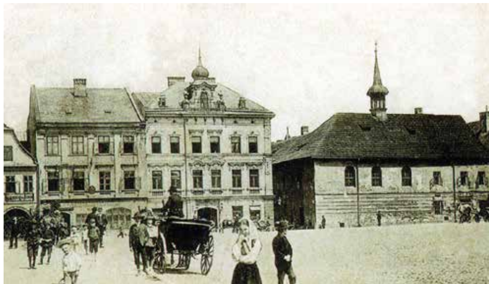
Rok 1902, z prawej strony kościół ss. Elżbietanek.