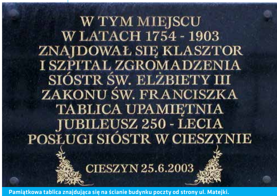
Pamiętkowa tablica znajdująca się na ścianie budynku poczty od strony ul. Matejki.