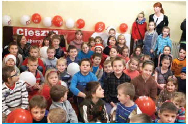
Oprócz uśmiechów dzieci na twarzach wielu z nich pojawiły się też i łzy... szczęścia.