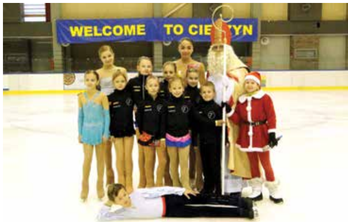
Na lodzie zaprezentowali się wychowankowie sekcji łyżwiarstwa figurowego Klubu Sportowego MOSiR Cieszyn oraz Klubu TJ SLAVOJ Czeski Cieszyn.