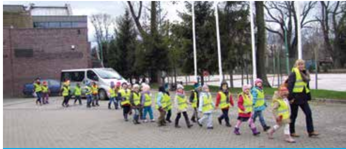
Dzieci wraz z opiekunkami z Przedszkola nr 20.