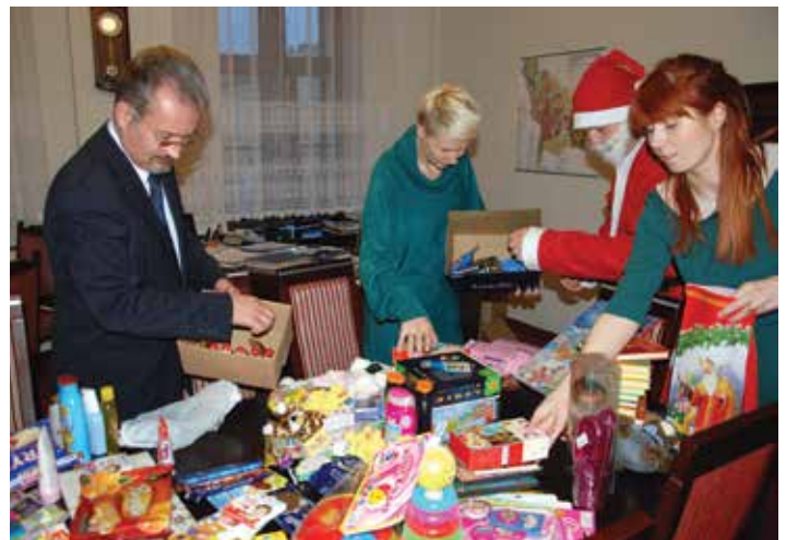
W akcję „Jesteśmy Świętym Mikołajem” organizowaną przez SPW „Być Razem” włączyli się także pracownicy Urzędu Miejskiego w Cieszynie.