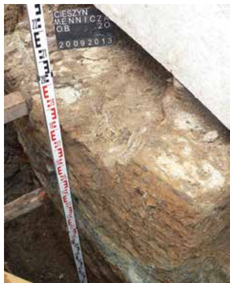
Fundament jednego filaru arkady odnaleziony w ul. Menniczej.